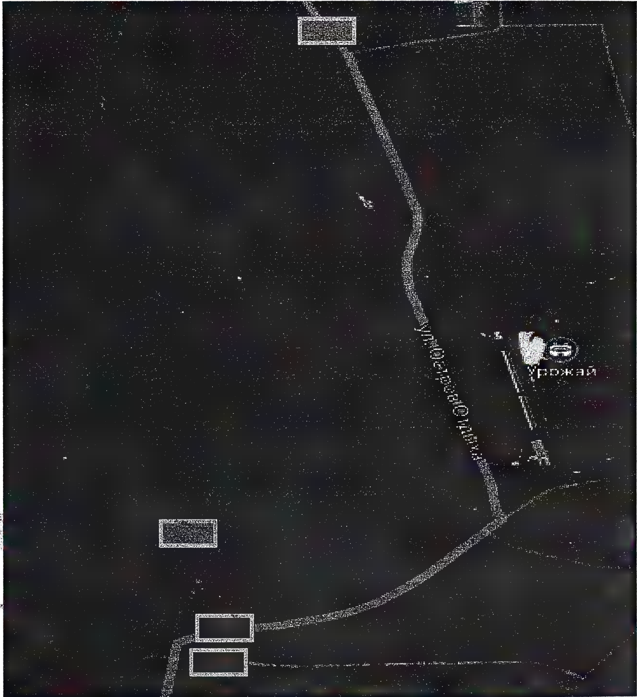
Схема выставления крупногабаритных ТС на участках дорожной сети п. Шушенское, примыкающей к месту проведения праздничных мероприятий 1 июня 2024 года на Острове отдыха в районе стадиона «Урожай» с 10:00 до 17:00 часов